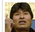
Evo Morales Ayma

"La propiedad privada siempre será respetada, pero queremos que la gente que no está interesada en la igualdad cambie su mentalidad y se concentre más en las necesidades del país que en el dinero", ha expresado Morales en el discurso que pronunció antes de repartir los títulos. Entre los afectados por la política de distribución de tierras está el ganadero Ronald Larsen, que se ha convertido en uno de los principales opositores a la reforma agraria. Larsen y los otros cuatro estancieros han amenazado con bloquear la entrada de los indígenas a las tierras.