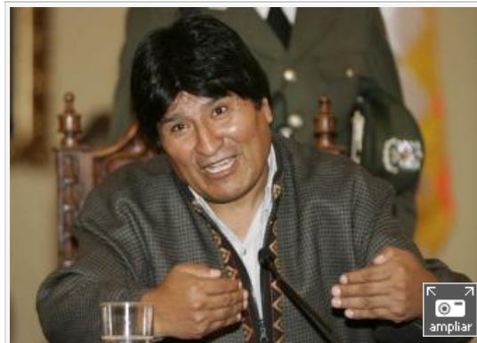
Morales ha entregado este sábado alrededor de 38.000 hectáreas a un grupo de indígenas guaraníes de Santa Cruz

"Estas tierras no eran improductivas sino que en ellas se producían violaciones a los derechos humanos de los guaraníes, que, a partir de ahora, serán sus nuevos dueños", ha declarado el presidente boliviano. Morales, líder cocacalero, es el primer presidente indígena (lleva tres años en el poder). El mandatario es especialmente popular entre la población más pobre y los grupos indígenas aymara, quechua y guaraní que sufrieron siglos de discriminación en el país más pobre de Sudamérica.